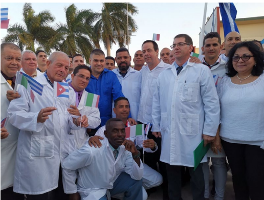
Kubanische Ärzte-Mission in Italien zur Bekämpfung von Corona.

Gebeutelt von jahrhundertelanger Sklaverei, kolonialistischer Ausbeutung und imperialistischer Diktatur, gehört die kleine Karibikinsel mit ihren elf Millionen Einwohnerinnen und Einwohnern zu der Mehrheit der armen Länder auf dem Globus. Während weltweit vier Milliarden Menschen, mehr als jede/r zweite, über keinerlei sozialen Schutz verfügen, auch nicht während der Pandemie, hat die kubanische Revolution 1959 in kürzester Zeit den Analphabetismus besiegt, ein hochentwickeltes, für alle kostenfrei zugängliches Gesundheits- und Bildungssystem errichtet, die Obdachlosigkeit nahezu überwunden, Bedingungen für eine lebendige, vielfältige und beeindruckende Kultur geschaffen. Kuba, das ist Sozialismus mit Musik.